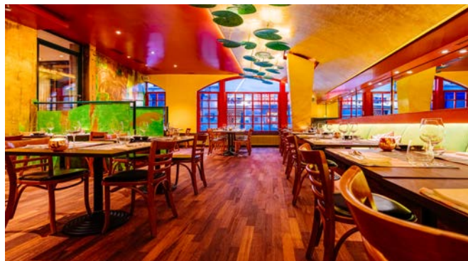
Blue Monkey Thai Restaurant