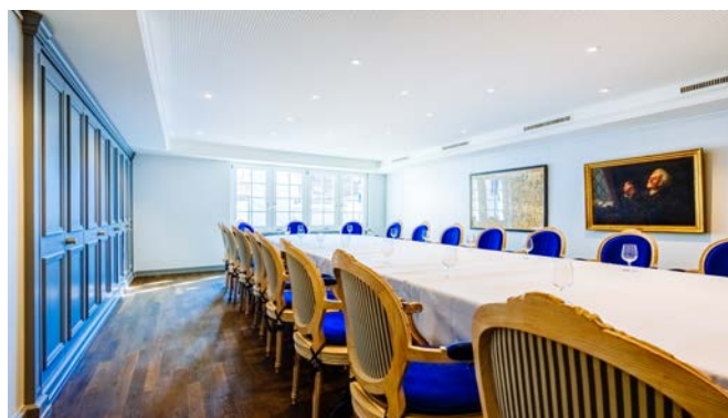
Zunfthaus zur Schneidern Carolistube