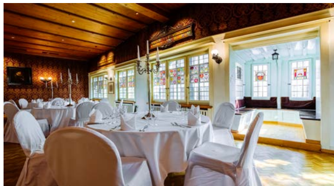
Zunfthaus zur Schneidern Zunftsaal